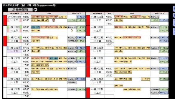
マルチスケジュールなし

マルチスケジュール機能とは、1枚岩の予定メインボードを過去及び未来用に複数枚のボードをご用意することが出来る機能です。画面上部にある日付指定枠にて日付を選択するとその日のボードが画面に表示されます。そこに予定を書いておくことでその日がくると自動でボードが切り替わり予定を表示します。