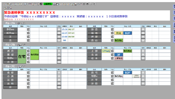
マルチスケジュールなし

マルチスケジュール機能とは、1枚岩の予定メインボードを過去及び未来用に複数枚のボードをご用意することが出来る機能です。画面上部にある日付指定枠にて日付を選択するとその日のボードが画面に表示されます。そこに予定を書いておくことでその日がくると自動でボードが切り替わり予定を表示します。