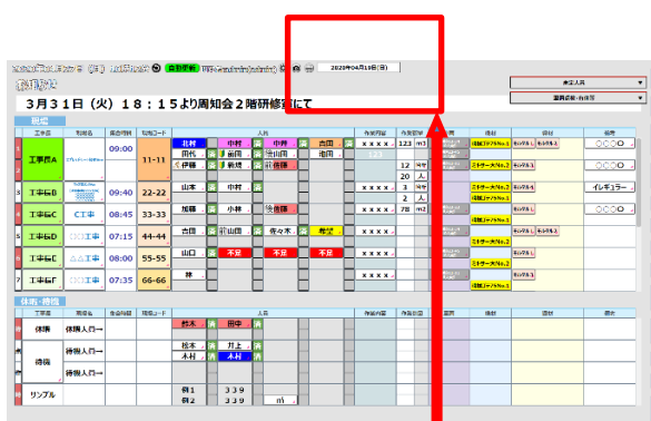
マルチスケジュールあり (日付選択枠あり)